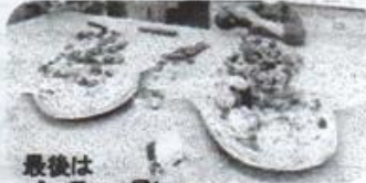
最後はパーティー風にテーブルコーディネート