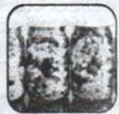
今話題の“ジャーサラダ”にも挑戦!